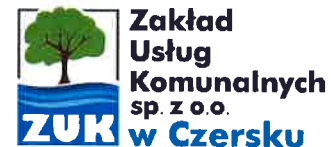
Tabela nr 1 - PRZYCHODY ORAZ KOSZTY I WYNIKI FINANSOWE Zakładu Usług Komunalnych Sp. z o.o. w Czersku za II kwartały 2022 roku